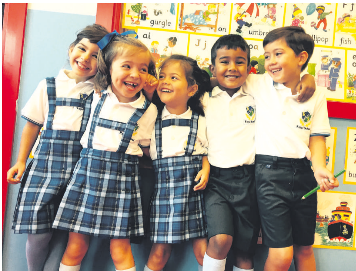
Alumnos y alumnas del British Royal School felices en una de las aulas