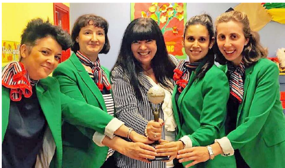
El Colegio Royal School recibió este año el Premio a la Excelencia en Formación

Los padres, que ya conocen el proyecto, han mostrado su entusiasmo