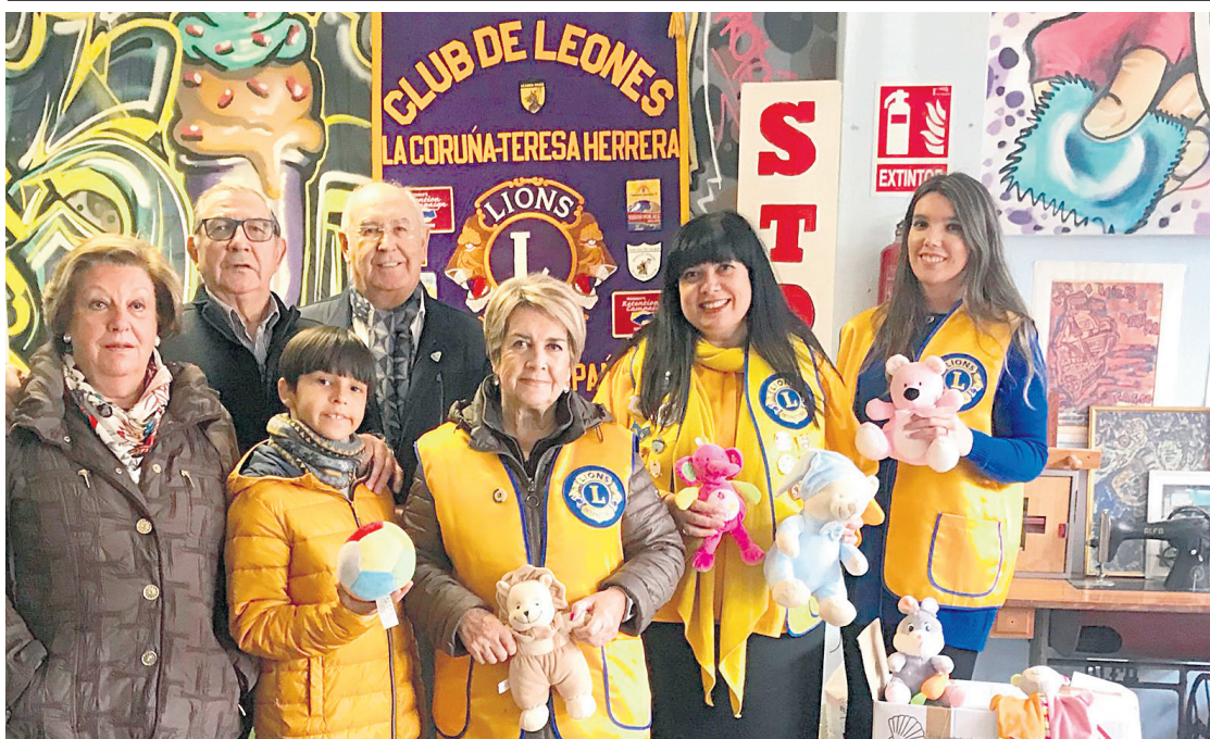
Esta semana, entregaron cientos de kilos de productos higiénicos, juguetes y alimentos, en diferentes entidades benéficas, ayudando a los más necesitados.