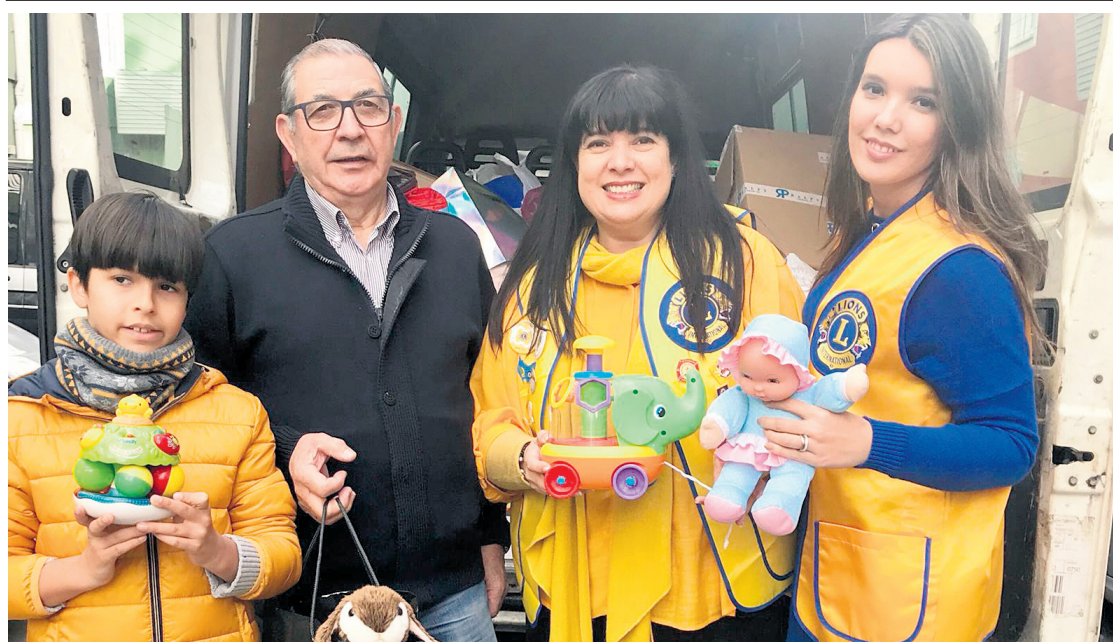
Las profesoras de Os Pequerrechos y las familias ayudaron en la campaña de recogida y distribución de regalos. En la foto llegando a la Asociación Renacer.

La Fundación Meniños lucha para que todos los niños puedan tener una familia